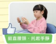
挺直腰頭，托起手肘